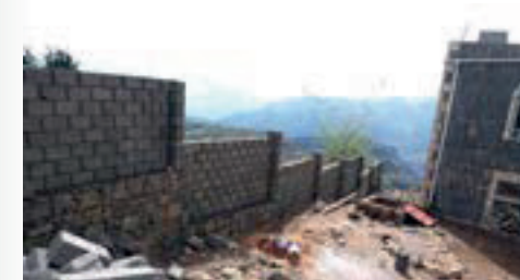
إعادة بناء سور مركز الدعم النفسي، محافظة حجة Rebuilding the fence of the Psychological Support Center , Hajjah Governorate