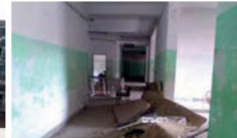
تقييم الاحتياجات الإنشائية لمستشفى الأمراض النفسية والعصبية ، محافظة عدن Evaluating the structural needs of the Psychiatric and Neurological Hospital, Aden Governorate